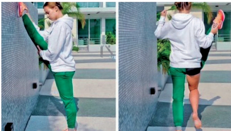
Рис. 3. Социальные сети полны обмана

Помимо экономических причин создания веб-страниц с вымышленными данными (фейковый аккаунт как способ продвижения продукта), мошенничества и политических игр, следует отметить психологические и социальные: безнаказанно «троллить»; слушать музыку или смотреть фильмы, но не получать рекламу на личный сайт; делиться откровениями, в которых стыдно признаться с настоящей страницы и т.п. Магдалена Шпунар пишет о мультипликации идентичности в сети, игре с подменной идентичностей и персональных страничках как инструменте самоподачи в выбранной пользователем ипостаси 50 . Размещаемый в аккаунте контент должен в первую очередь вызывать интерес у других людей и представлять интернавта в соответствии с желаемыми атрибутами. Таким образом, персональные странички в Instagram, Facebook, ВКонтакте превращаются в некий альтернативный фиктивный мир, где у всех идеальная фигура (рис. 3), беззаботная жизнь и тысячи фолловеров-друзей.