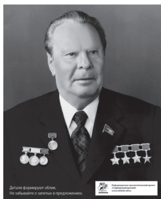
Рис. 2. Детали формируют облик. Леонид Брежнев. http://nibler.ru/amazing/13381-feykstival-2012-luchshie-raboty.html