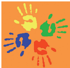
Rys. 1. Logo Centrum Ekspresji Dziecięcej i katowickich Festiwalu ekspresji

Symbolem Centrum Ekspresji i Festiwalu od drugiej edycji są dziecięce dłonie (rys. 1), cztery kolorowe odciski układające się w słońce – tworzą znak ekspresyjnego działania 44 . Jest to znak doskonale egzemplifikujący znaczenie ekspresji dla rozwoju – nie tylko – kilkulatka. Ekspresja bowiem to z jednej strony dopuszczenie do swojej intymności, do tego, co odczuwam i jak rozumiem świat. Z drugiej zaś – to obcowanie we wzajemnym zrozumieniu i szacunku, to porozumienie, zaufanie, wspólne doznawanie radości płynącej z tworzenia. Dłonie – gotowe na działanie – są również doskonałą metaforą finalizującą całość pomieszczonych w tym artykule rozważań, zwłaszcza jeśli za perspektywę przyjmie się ucieleśniony wymiar ekspresji artystycznej. A uzupełnieniem tej wizualnej przenośni niech będą słowa motta jednego ze spektakli przygotowanych przez dzieci: