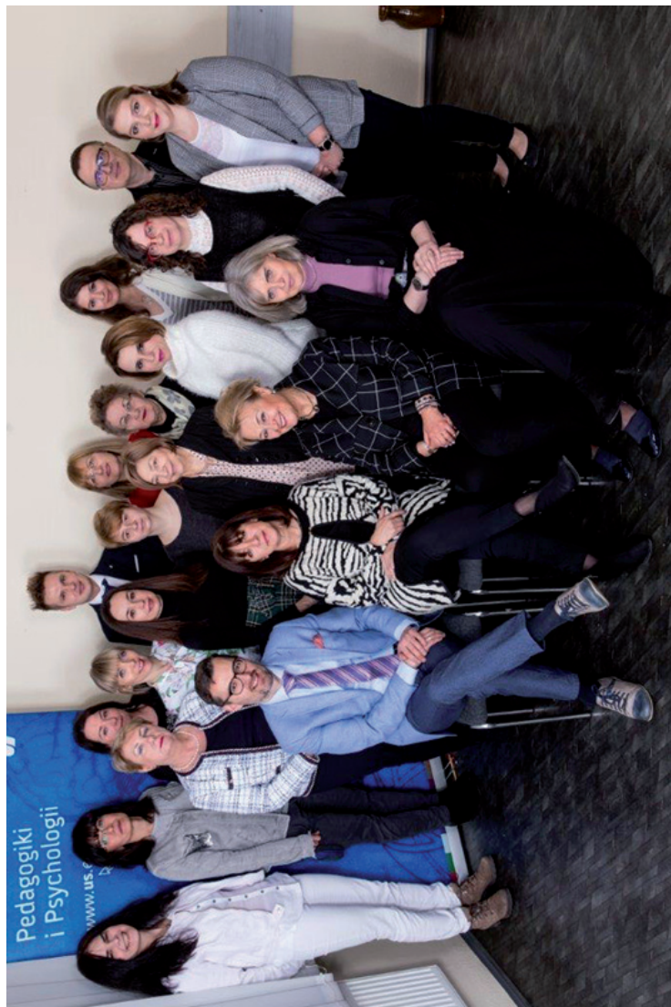
Pracownicy Katedry Pedagogiki Społecznej Uniwersytetu Śląskiego w Katowicach (luty 2019 roku).