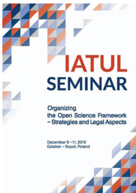
Fot. 1. Okładka broszury konferencyjnej (IATUL Seminar 2019 „Organizing the Open Science Framework – Strategies and Legal Aspects”, 2019)