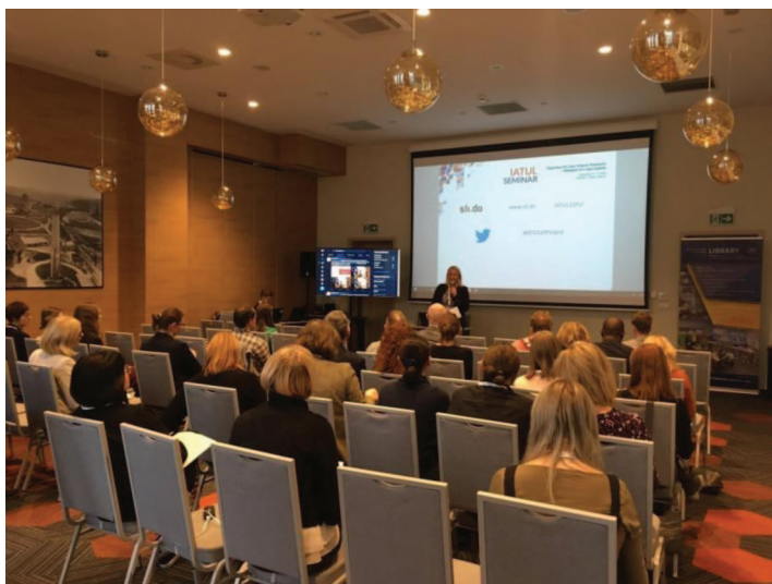
Fot. 2. IATUL Seminar 2019

Aspects (program wydarzenia: https://pg.edu.pl/biblioteka-pg/programme ). IATUL Seminar odbywa się co roku w innym kraju członkowskim, co nadaje wydarzeniu cykliczny charakter. Przedstawiciele bibliotek akademickich zrzeszonych w IATUL spotykają się w celu wymiany swoich doświadczeń, podsumowania dotychczasowych osiągnięć oraz określenia przyszłych wyzwań. Tegoroczna konferencja zgromadziła ok. 60 osób, reprezentujących ośrodki akademickie z różnych zakątków świata (zob. fot. 2). Wśród uczestników byli nie tylko bibliotekarze i naukowcy, ale także inne osoby zaangażowane w rozwój nauki. IATUL Seminar 2019 było na bieżąco relacjonowane i promowane w mediach społecznościowych BPG na Twitterze i Facebooku (#IATUL19Poland).