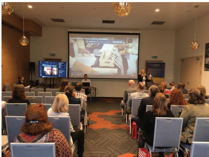
Fot. 3. IATUL Seminar 2019