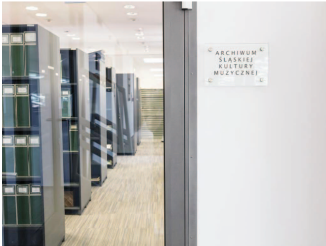
Fot. 2. Archiwum Śląskiej Kultury Muzycznej w 2017 r.