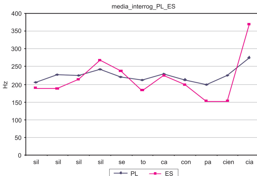
Figura 2. Comparativa de contornos en oraciones interrogativas