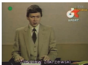
Fot. 2. Źródło: „Dziennik Telewizyjny”, 8.12.1984 r.

Po czwarte, nie może ująć uwagi, że telewizja jako medium masowe wyrosła na trzech tematach: informacjach społecznych, sportowych i prognozie pogody. Zmiany w tych obszarach powinny zatem ciągle być przedmiotem zainteresowania badaczy. W miarę wzbogacania instrumentarium naukowego możemy wnikliwiej opisywać ten przedmiot badawczy, dając asumpt do konstatacji o tym, jak kultura na nie wpływa i jak one same wpływają na kulturę. Tę w wymiarze globalnym (bo telewizja ją bierze poważnie pod uwagę) i tę w wymiarze lokalnym (akurat, co sygnalizowałam, sport i prognoza pogody mają tu istotne zasługi).