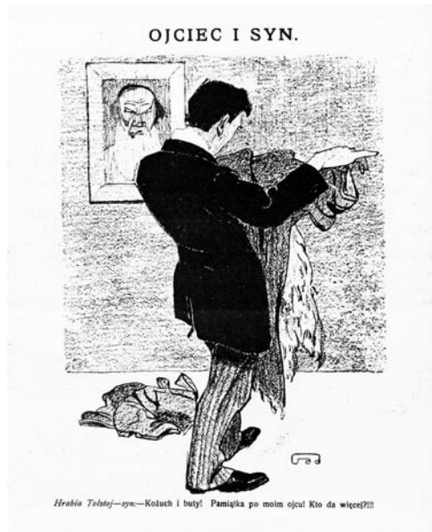
Рисунок № 3: Ојсіє і сын, рис. неизв. автора («Nowy Szczutek» 1910, № 40)