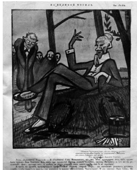
Рисунок № 1: На великой могиле, рис. Ре-Ми [Н. Ремизов-Васильев] («Сатирикон» 1910, № 48)