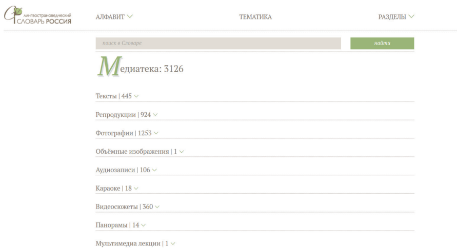
Rys. 1. Strona internetowa MSL. Widok na stronę główną „Медиатека”

Elektroniczną wersję słownika cechują hipermedialność oraz interaktywny charakter. Wersja sieciowa wzbogacona została o materiały multimedialne: fragmenty filmów, piosenek, zabaw oraz zadań interaktywnych. Na 887 artykułów hasłowych w słowniku znalazły się 3143 ilustracje multimedialne oraz 389 zadań interaktywnych na poziomie A1–C2. Dane te mogą ulec zmianie. Interaktywność słownika przejawia się również w tym, że możliwa jest komunikacja jego autorów z użytkownikami. Leksykografowie otrzymują informację zwrotną, dzięki czemu są w stanie poznać potrzeby czytelników i udoskonalać projekt.