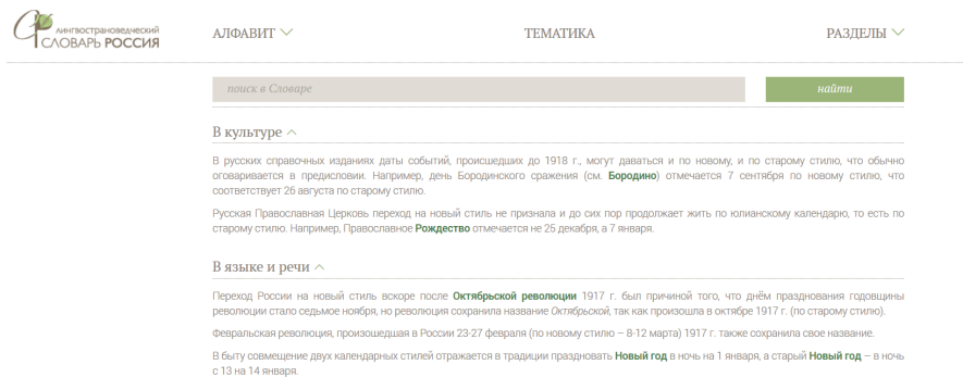
Rys. 2. Strona internetowa MSL. Widok na hasło старый стиль .

Różnice i podobieństwa między wersją papierową a elektroniczną słownika zaobserwujemy na konkretnym artykule hasłowym. Za przykład posłużą nam hasło „старый стиль».