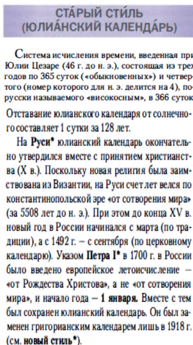
Rys. 2. Zdjęcie artykułu hasłowego старый стиль w słowniku papierowym, s. 550.