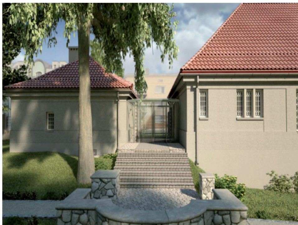
Fot. 6. Wizualizacja obiektu po renowacji. Frame Studio Dariusz Wierzbowski