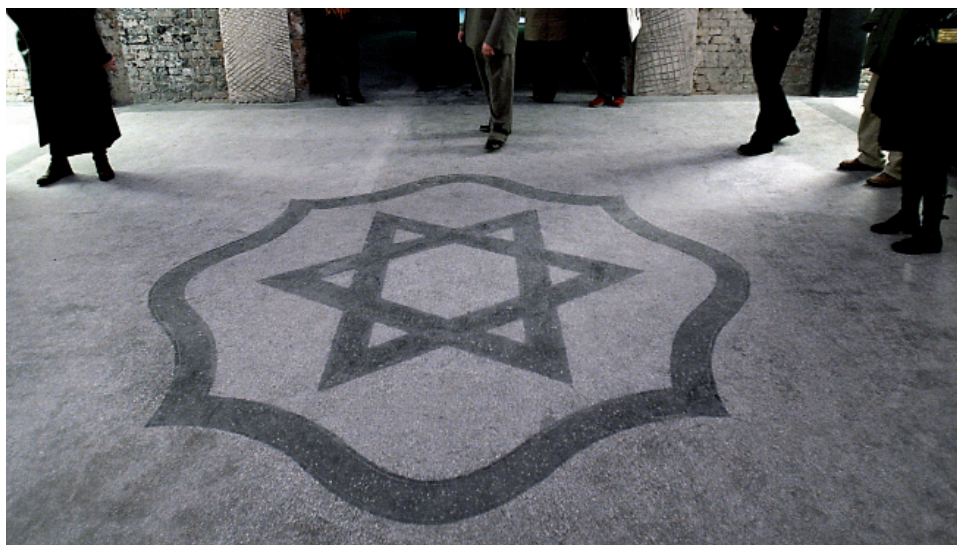
Fot. 4. Oryginalna posadzka w Sali Pożegnań. Stan z 2012 roku.