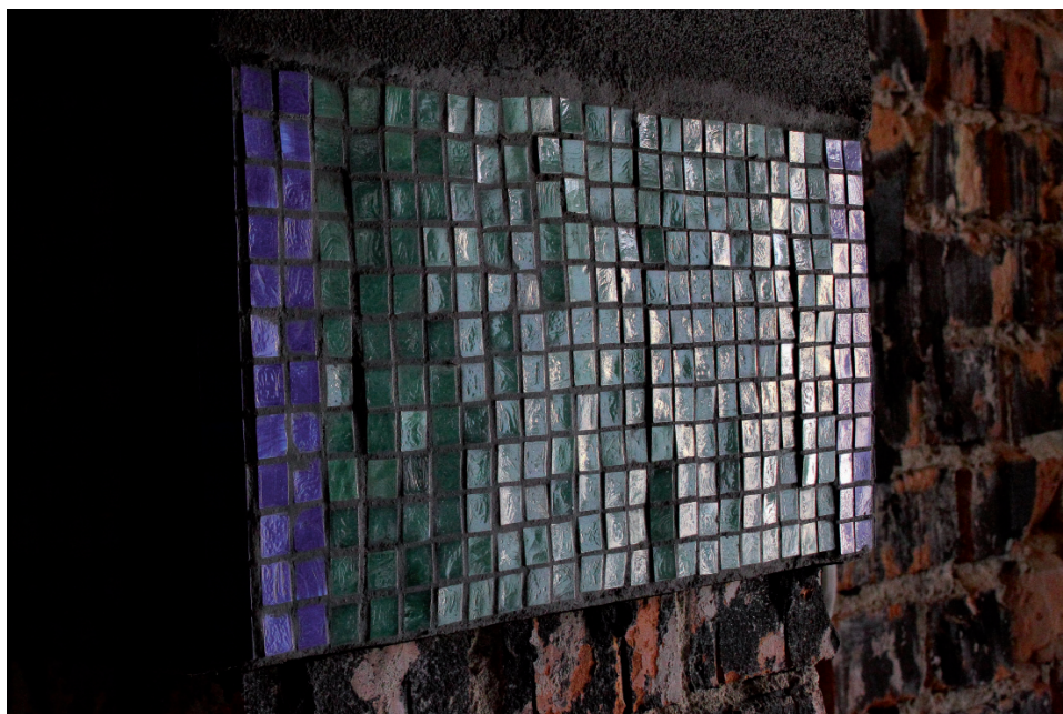
Fot. 5. Rekonstrukcja mozaik. Stan z 2012 roku.