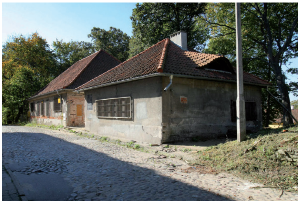
Fot. 1. Bet Tahara. Stan z jesieni 2010 roku.