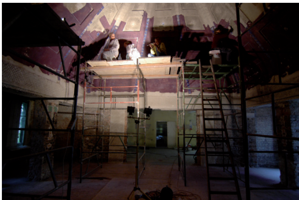
Fot. 2. Rekonstrukcja kopuły. Stan z 2007 roku.