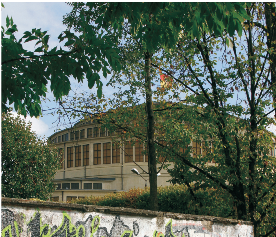
Fot. 2. Wrocław, zespół Hali Stulecia – nieodpowiadająca prestiżowi miejsca granica od strony ul. Wróblewskiego

analizy spełniło w najwyższym stopniu. O wysokiej ocenie całego zespołu zdecydowały w dużym stopniu granice, które bardzo mocno wydzielały teren osiedla z otoczenia. Najwyraźniejsze granice zespołu występują od strony północnej, zachodniej i południowej, ponieważ utworzone są przez kilka elementów: długie odcinki ciągłej linii zabudowy, równoległe usytuowane ulice, chodniki, ogrodzenia (często występujące w formie strzyżonych żywopłotów), towarzyszące zabudowie szpalery i aleje drzew, a także linie tramwajowe na wydzielonym torowisku oraz skarpa. Z takich elementów o prostych zasadach wzajemnego usytuowania ukształtowane są granice osiedla, które m.in. z tego powodu daje mieszkańcom bardzo wyraźne poczucie tożsamości miejsca. Sępolno zostało wybudowane w latach 1919–1935. W historii osadnictwa miejskiego jest znane jako przykład zrealizowanej koncepcji osiedla-ogrodu, realizującej idee Ebenezera Howarda 9 . Współcześnie jest dobrze postrzegane – pomimo narastających zaniedbań