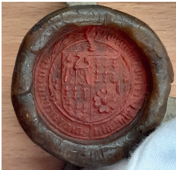
Fot. 4. Pieczęć mniejsza biskupa Piotra Nowaka, AP Wrocław, Dokumenty miasta Wrocławia, nr 3976