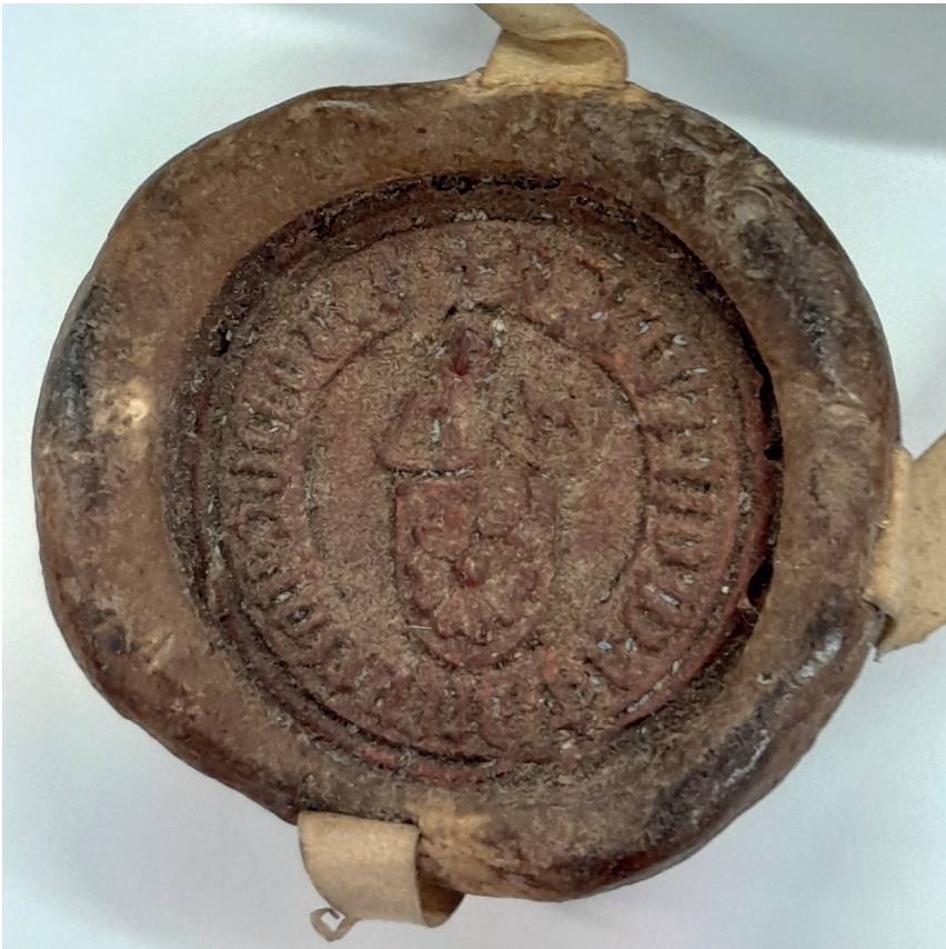
Fot. 1. Pieczęć osobista Piotra Nowaka, AP Wrocław, Rep. 102, nr 700 (701)

wyłącznie na paskach pergaminowych, natomiast większą dość często (47% odcisków) również na sznurach, zwykle biało-czerwonych. Barwę sznurów przejęła kancelaria Jodoka, która jednak częściej przywieszała na nich odciski pieczęci większej (61% odcisków). Częściej też stosowano w niej wosk barwiony na czerwono (51% odcisków pieczęci mniejszej i 13% odcisków pieczęci większej). Przedstawione badania pozwoliły także naświetlić przypadek długiego „życia” typariuszy biskupich Piotra Nowaka, przejętych następnie przez Jodoka, co umożliwiało podobieństwo herbów osobistych (rodowych) obu hierarchów. Na koniec stwierdzić należy, że oba poddane analizie systemy sfragistyczne charakteryzują się wysokim stopniem rozwoju, odzwierciedlając przy tym – jak już wspomniano – kariery swoich właścicieli. Specyfikacja w stosowaniu poszczególnych sigillów do uwierzytelniania dokumentów określonej treści zarysowana jest jednak mocniej w przypadku systemu należącego do Piotra Nowaka. W kancelarii biskupa Jodoka nie ujawniono szczególnych zasad doboru odpowiedniego typu pieczęci do konkretnego typu dyplomów.