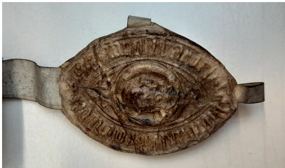
Fot. 3. Pieczęć administracyjna biskupstwa wrocławskiego używana przez Piotra Nowaka, AAd. Wr., Dokumenty parafii w Świdnicy, 21 XII 1444