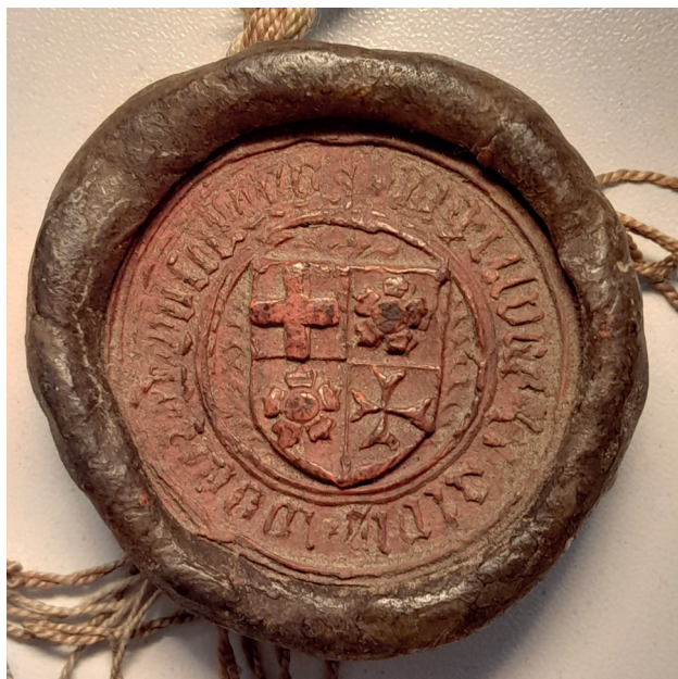
Fot. 6. Pieczęć zakonna Jodoka z Rožemberka, AP Opole, Akta miasta Nysy, nr 212