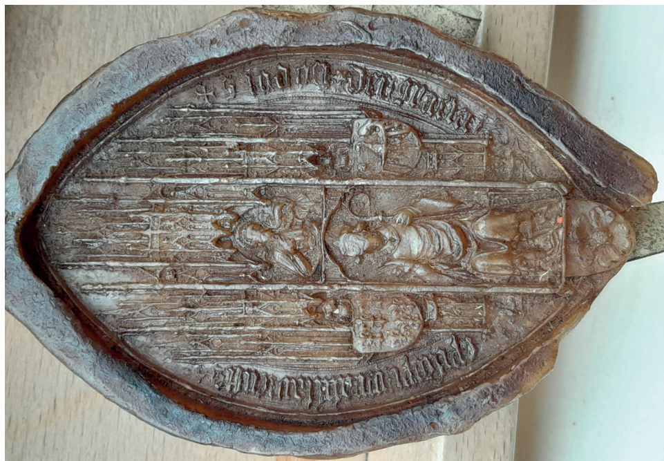
Fot. 8. Pieczęć większa biskupa Jodoka, AAd. Wr., Dokumenty oznaczone sygnaturami alfabetycznymi, PP 25