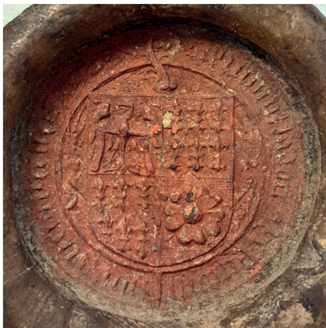
Fot. 7. Pieczęć mniejsza biskupa Jodoka o średnicy 40 mm, AP Opole, Akta miasta Nysy, nr 222