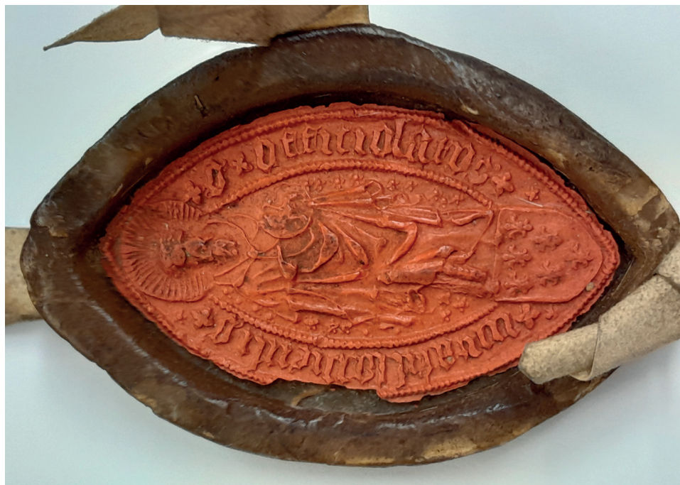
Fot. 2. Pieczęć oficjalatu używana przez Piotra Nowaka, AP Wrocław, Rep. 132a, Depozyt miasta Dzierżoniowa, nr 34 (72)