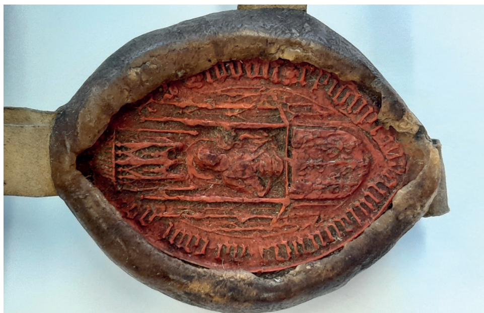
Fot. 9. Pieczęć ad causas biskupa Jodoka