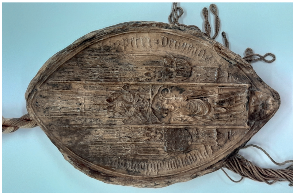
Fot. 5. Pieczęć większa biskupa Piotra Nowaka, AP Wrocław, Rep. 68, nr 145 (279)