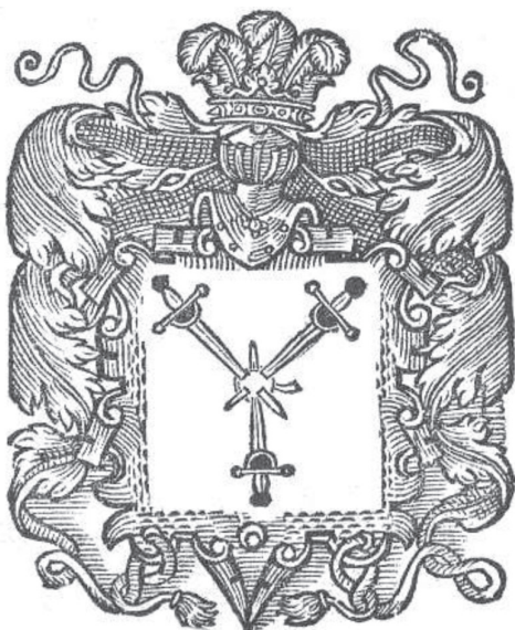
мал. 7: герб панів Гербуртів у гербовнику Папроцького «Gniazdo snoty» 1578 р.

ломником у вигляді золотих павичевих пер. 20 Подібний вигляд цей герб має й у моравському гербовнику «Zrcadlo slavného Markrabství Moravského» авторства Бартоша Папроцького — «O Rodu a Erbě Panův Herburtůw z Fulssteyna ... kterýž vžil za Erb Jablka Zlatteho na Czerweném Stijtu ... A k tomu na věčnu památku, ty tři Meče na gich znamenij Rytijřském Křížem položiwssy, za Erb vžiljati rozkázal, přidawssy gim nad Helm Páwowý Ocas». 21