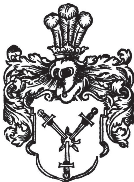
мал. 8: герб панів Гербуртів у гербовнику Папроцького «Herby rycerstwa polskiego» 1584 р.

Натомість, більшість тогочасних та пізніших польських гербовників представляють дещо іншу версію родового герба — три срібних меча в зірку пронизують зелене яблуко на червоному щиті, над яким розміщено шолом під шоломовою короною та нашоломник у вигляді трьох страусових пер. 22