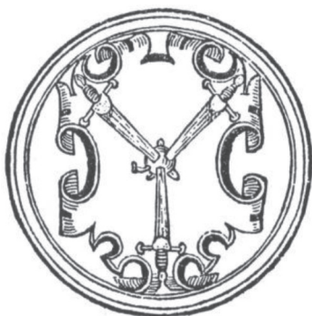
мал. 11: герб панів Гербуртів в гербовниках Рея «Zwierzyniec» 1562 р. і Папроцького «Panosza» 1575 р.