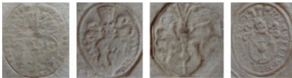
мал. 40: печатки Йоана Щасного Гербурта Добромильського пана з Фельштина 27.I.1593, 7.VII.1593, 1594 і 1596 рр.