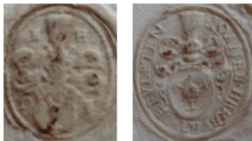
мал. 38: печатка Еразма Гербурта Добромильського пана з Фельштина 1589 р.