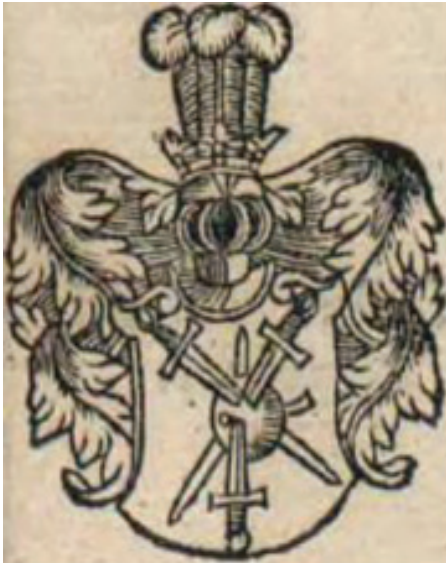
мал. 9: герб панів Гербуртів у «Kronice Polskiej Marcina Bielskiego» 1597 р.