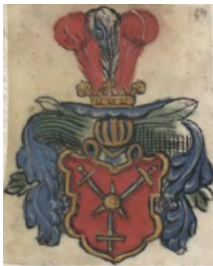
мал. 16: герб панів Гербуртів у гербовнику «Stemmata Nobilium Regni Poloniae» XVII ст.

ристуку родовий герб має в пізнішому гербовнику «Stemmata Nobilium Regni Poloniae» від XVII ст. — три срібних меча з золотими руків'ями в зірку пронизують золоте яблуко на червоному полі щита під шоломом із блакитно-срібним наметом і шоломовою короною з нашоломником у вигляді трьох страусових пер, середнє з яких срібне, а бічні — червоні. 29