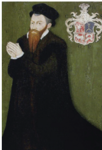
мал. 18: портрет Йоана Гербурта пана з Фельштина 1577 р.