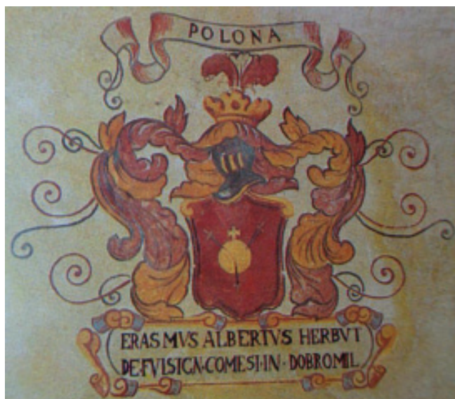
мал. 43: герб Еразма Альберта Гербурта Добромільського пана з Фельштина в залі Падуанського університету від 1615 р.

Дещо відмінне забарвлення цей герб має в рукописному гербовнику студентів Падуанського університету від 1614 р. — три срібних меча з золотими руків'ями в зірку пронизують срібне яблуко під срібним хрестиком на червоному полі ренесансного щита, над яким розташовано шолом з червоно-золотим наметом під шоломовою короною, в нашоломнику п'ять страусових пер — три срібних і два червоних. В бароковому картуші напис: ERASMVS ALBERTVS HERBVLTV DE FVLSTGN COMESI IN DOBROMIL. 82