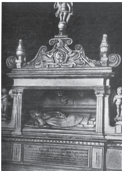
мал. 21: надгробок Йоана Гербурта пана з Фельштина кінця XVI ст.