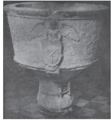
мал. 23: надгробок Криштофа Гербурта 1558 р.