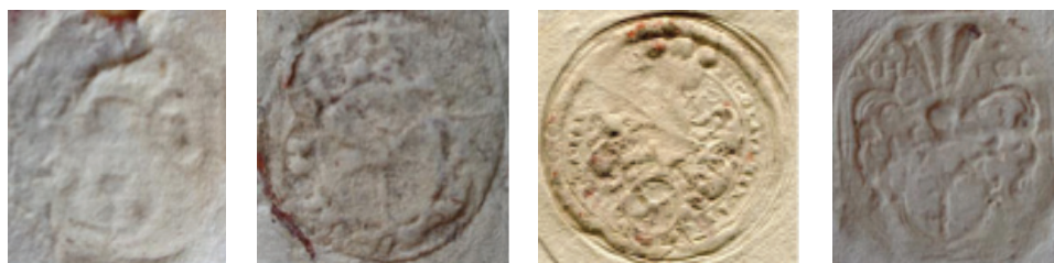
мал. 30: печатка Абрагама Гербурта пана з Міжинця 1598 р.

На одній із печаток Абрагама Гербурта пана з Міжинця, якою засвідчено лист від 1605 р., герб розміщено в овальному бароковому щиті. 50 На його попередній печатці від 1598 р. над ренесансним щитом розташовано шолом із наметом під шоломовою короною. На печатці перемишльського єпископа (1560—1572) Валентина Гербурта від 1567 р. над гербовим щитом розміщено єпископську інфулу. 51