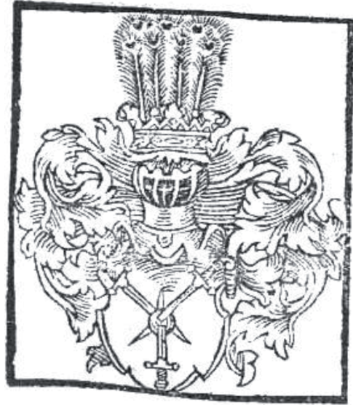
мал. 6: герб панів Гербуртів у гербовнику Папроцького «Zrcadlo slavného Markrabství Moravského» 1593 р.

Найдавніше кольорове зображення герба панів Гербуртів походить від 1523 р. На земських таблицях Опавського князівства представлено герб найвищого земського комірника Опавського князівства Оіржа пана з Фульштайна й на Битовіцях — три срібних меча з золотими руків'ями, що пронизують у зірку золоте яблуко на червоному щиті під шоломом із короною й нашо-