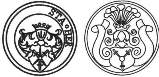
мал. 35: печатка Станіслава Гербурта пана з Фельштина 1569 р.

Йоана Гербурта пана з Фельштина від 1567 р. 58 та сяноцького каштеляна (1568—1577) і перемишльського старости (1569—1577) Йоана Гербурта пана з Фельштина від 1570 р. 59 Герб останнього присутній також на малярку в перемишльській гродській книзі від 1575 р., з тим самим нашоломником і в оточенні літер: IHDFCSCP. 60