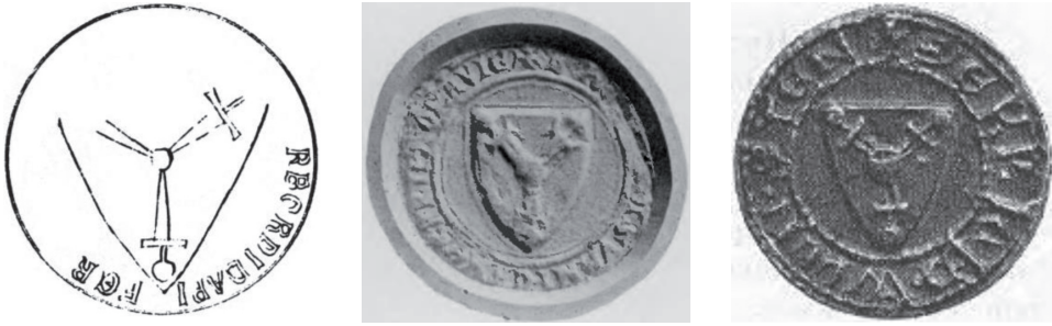
мал. 1: печатка пана Герборта 1255 р.