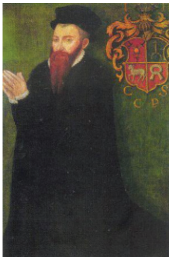
мал. 17: портрет Йоана Гербурта пана з Фельштина 1570 р.

ристуку родовий герб має в пізнішому гербовнику «Stemmata Nobilium Regni Poloniae» від XVII ст. — три срібних меча з золотими руків'ями в зірку пронизують золоте яблуко на червоному полі щита під шоломом із блакитно-срібним наметом і шоломовою короною з нашоломником у вигляді трьох страусових пер, середнє з яких срібне, а бічні — червоні. 29