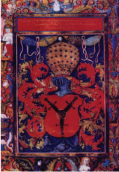
мал. 5: герб панів Гербуртів на земських таблицях Опавського князівства 1523 р.

Міече»), 16 1436 р. («sigillum Herbortonis vexilliferi: Міече») 17 та 1439 р. («sigillum Herborti: tres gladij in romo») 18 . Так само, як і львівський (1436) і перемишльський (1437—1447) ловчий Миколай (Міклаш) Гербурт із Фельштина у 1439 р. («sigillum Miklasz: tres gladij in romo») 19 .