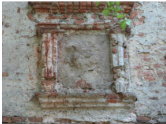
мал. 42: герб Йоана Щасного Гербурта Добромильського пана з Фельштина на плиті над брамою Добромильського замку від 1614 р.

і 1613—1616 рр. 77 Три страусових пера — на печатках від 1596—1598 78 і 1606 рр. 79 Вірогідно, такий герб було зображено також на плиті від 1614 р., залишки якої досі прикрашають в'їзну браму Добромильського замку. 80