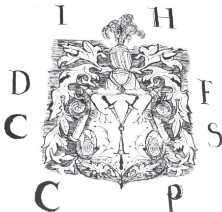
мал. 34: герб Йоана Гербурта пана з Фельштина на малюнку в перемишльській градській книзі 1575 р.

на від 1572—1573 рр., 52 перемишльського підкоморія (1568—1570), руського генерального старости (1570—1593), галицького (1585—1589) і перемишльського каштеляна (1589—1593) Миколая Гербурта пана з Фельштина від 1573—1591 рр., 53 1579—1581 рр. 54 і 1590 р. 55