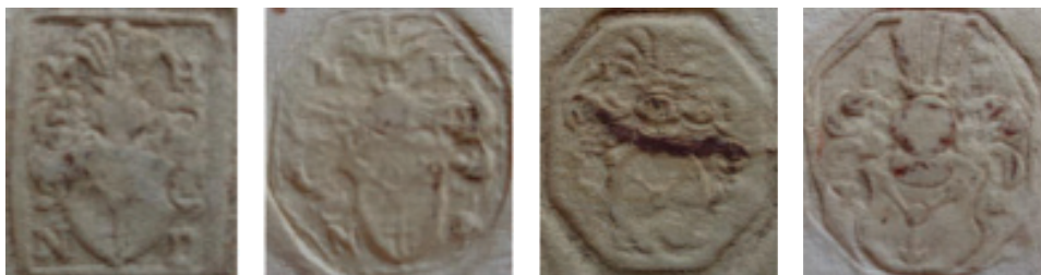
мал. 37: печатки Миколая Гербурта пана з Фельштина і Децилова 1589, 1589—1590, 1590 і 1596 рр.

на його пізнішій печатці від 1596—1601 рр. в нашоломнику бачимо зображення трьох павичевих пер. 67 П'ять павичевих пер знаходилося в клейноді родового герба на печатці Еразма Гербурта Добромильського пана з Фельштина від 1589 р. 68