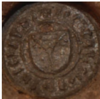
мал. 4: печатка Фридриха Гербурта з Фельштина 1436 р.

і 1296 рр., 11 оломоуцьких каноніків Герберта й Микулаша панів із Микуловиць від 1349 р. і Альбрехта пана з Крженовиць від 1356—1365 рр. 12