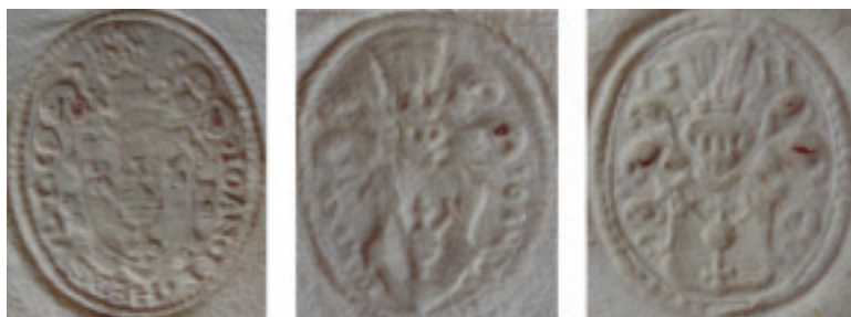
мал. 41: печатки Йоана Щасного Гербурта Добромильського пана з Фельштина 1598, 1599 і 1600 рр.

Найбільшу варіативність в зображеннях нашоломника спостерігаємо на печатках королівського секретаря, добромильського й мостиського старости Йоана Щасного Гербурта Добромильського пана з Фельштина. Зокрема, на відбитку від 7 липня 1593 р. клейнод має п'ять павичевих пер. 71 А на печатках від 1598—1599, 72 1599 73 і 1600—1604 рр. 74 — три павичевих пера. Дев'ять страусових пер присутні в нашоломнику на відтиску його печатки від 27 січня 1593 р. 75 П'ять страусових пер — на печатках від 1594 76