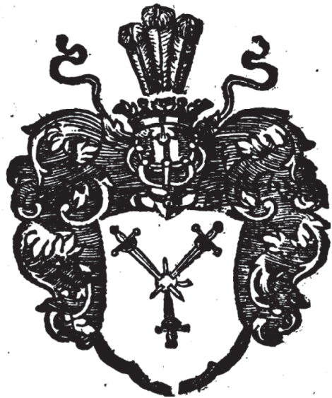
мал. 10: герб панів Гербуртів у гербовнику Окольського «Orbis Polonus» 1641 р.

Лише в окремих випадках герб панів Гербуртів представлено в гербовниках без інформації про забарвлення та позащитові елементи — у ренесансному щиті три меча в зірку пронизують яблуко. 23