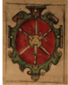
мал. 13: герб панів Гербуртів у «Stemmata Polonica»