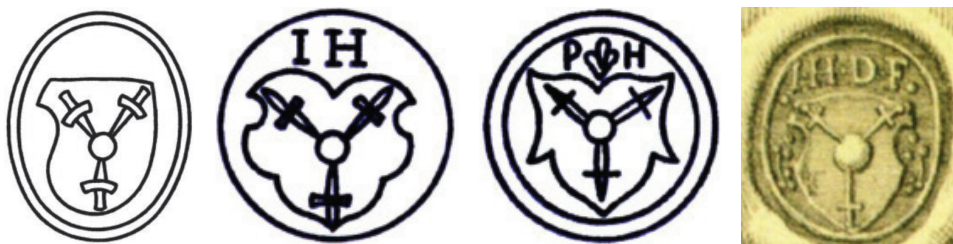
мал. 26: печатка Андрія Гербурта з Фельштина 1512 р.