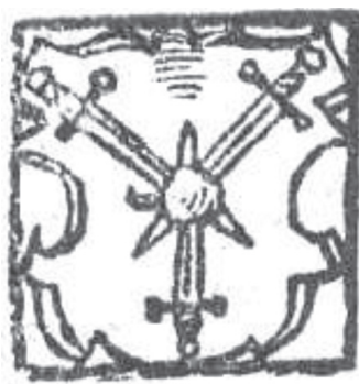
мал. 12: герб панів Гербуртів у гербовнику Папроцького «Diadochos» 1602 р.

Кольорові версії неповного герба панів Гербуртів подають рукописні гербовники: «Stemmata Polonica» середини XVI ст. — на червоному полі три срібних меча з чорними руків'ями в зірку пронизують золоте яблуко з зеленим листям («Herbortowa»), 24 «Arma Regni Poloniae» Марка Амброзія з Ниси від 1562 р. — на червоному полі три срібних меча з чорними руків'ями в зірку пронизують золоте яблуко з зеленим листям («Herbortowa») 25 та гербовник Еразма Каміна «Liber insigniorum regionum atque clenodiorum Regni Poloniae summa cum diligencia elaboratus 1575» — на червоному полі три срібних меча в зірку пронизують золоте яблуко («Herborthowa in campo rubeo pomum aureum tribus gladiis ad instar crucis aciebus transfixum portans pro armis. Genus Almanicum») 26 Як бачимо, саме в цих творах простежу-