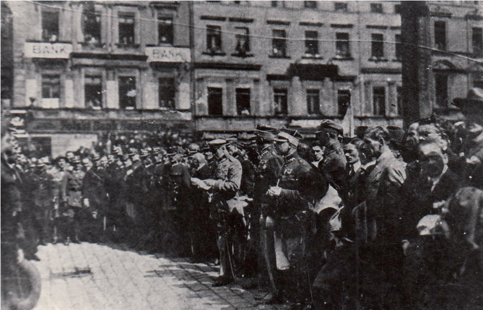
Fot. 2. Rynek w Katowicach, 28 sierpnia 1922 roku, marszałek Józef Piłsudski odczytuje nazwiska odznaczonych Krzyżem Virtuti Militari i Krzyżem Walecznych (wśród nich nie było W. Fojkisa)

Powracając do organizacji ruchu powstańczego: jesienią 1922 roku centrale obydwu organizacji przestały funkcjonować. W przypadku ZPG PPS zdecydowały o tym względy finansowe, natomiast w odniesieniu do ZBP — ponowny rozłam już i tak osłabionej organizacji. Tym razem cios kadłubowemu ZBP zadali J. Wyglenda i W. Fojkis, podpisując odezwę wyborczą Bloku Narodowego (BN). Pod względem politycznym decyzja ta ustawiła ZBP po chadeckiej stronie sceny politycznej i spowodowała odpływ z organizacji członków o orientacji endeckiej 35 .