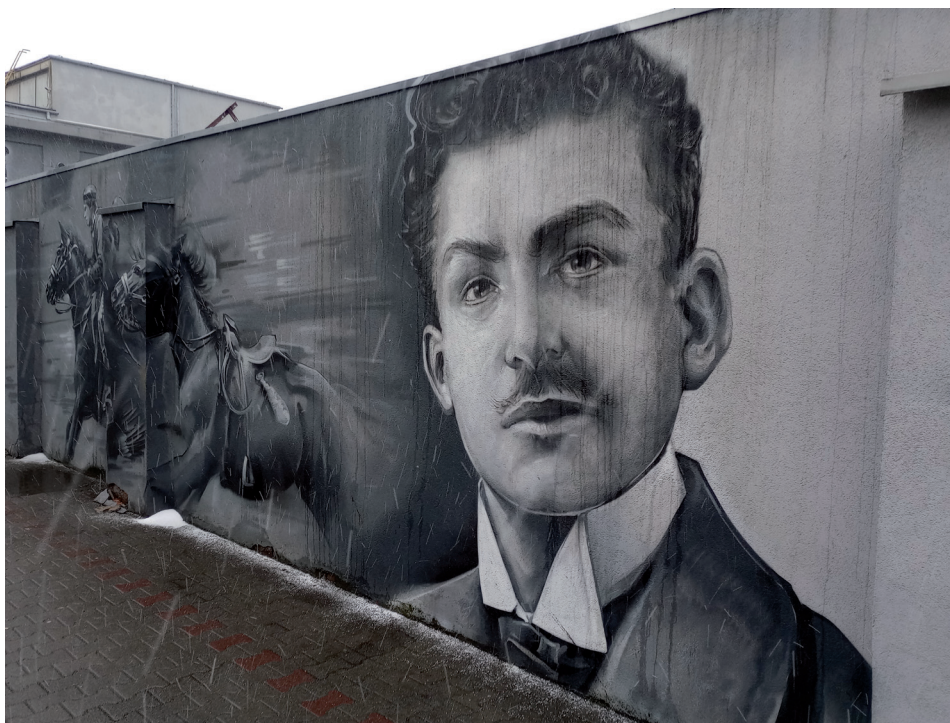
Fot. 1. Mural autorstwa Wojciecha Walczyka przedstawiający Walentego Fojkisa, Siemianowice Śląskie

Należy w tym miejscu zauważyć, że nieprawdziwa jest — często przywoływana w tekstach poświęconych W. Fojkisowi — informacja o sprawowaniu przez niego mandatu posła do sejmiku warszawskiego. Taka wzmianka umieszczona została mylnie w Encyklopedii powstań śląskich 9 i prawdopodobnie dzięki popularności tej pozycji błąd ten wciąż bywa powielany — ostatnio np. na tablicy informacyjnej w Alei Polskiego Dziedzictwa Śląska w Katowicach. Przepuszczalnie ze względu na podobieństwo nazwisk został błędnie utożsamiony z faktycznie sprawującym wówczas taki mandat Wilhelmem Fojcikiem, również byłym powstańcem śląskim. Działalność W. Fojkisa w ogólnopolskim parlamencie nie może więc zostać włączona do rozważań.