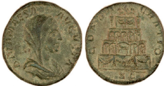
Fot. 12. RIC IV/2 Julia Maesa , nr 712. Sesterc, Rzym. Aw.: DIVA MAESA AVGVSTA. Rew.: CONSECRATIO SC