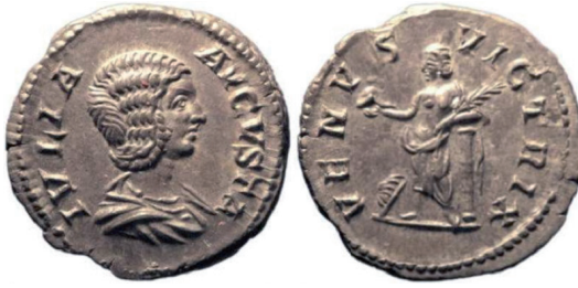
Fot. 7. RIC IV/1 Julia Domna , nr 581. Denar, Rzym. Aw.: IVLIA AVGVSTA. Rew.: VENVS VICTRIX