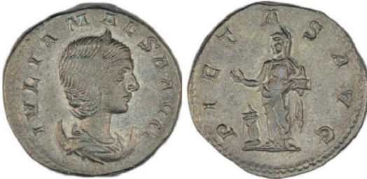
Fot. 11. RIC IV/2 Julia Maesa , nr 264. Antoninian, Rzym. Aw.: IVLIA MAESA AVG. Rew.: PIETAS AVG