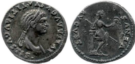
Fot. 2. RIC II/1 Julia Titi , nr 388. Denar. Aw.: IVLIA AVGVSTA TITI AVGVSTI F. Rew.: VENVS AVGVST

Wenus z atrybutami militarnymi występowała już na monetach Oktawiana ( Octavianus ). Prezentowana była na nich jako stojąca tyłem półnaga bogini, która w lewej ręce, wspartej na niskiej kolumnie, trzyma szept, z kolei w wyciągniętej prawej – hełm, u stóp zaś ma tarczę 4 . Ten model przedstawienia był powielany przez Flawiuszy 5 . Należy zwrócić uwagę, że tylko w emisjach dedykowanych kobietom, Julii ( Julia Flavia ) (fot. 2) 6 i Domicji ( Domitia Longina ) 7 , w legendzie rewersu pojawia się imię Wenus. W emisjach tych pominięto tarczę jako atrybut bogini.