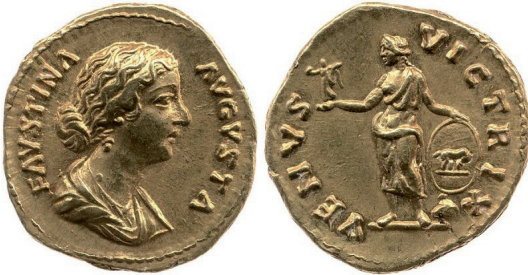
Fot. 4. RIC III/3 Faustina II , nr 736. Aureus, Rzym. Aw.: FAVSTINA AVGVSTA. Rew.: VENVS VICTRIX

na emisje monet z identycznym przedstawieniem bogini, lecz odmienną legendą rewersu: VENVS VICTRIX (fot. 4) 14 . Podkreślić trzeba, że Faustyna Młodsza była pierwszą kobietą z rodziny cesarskiej, na monetach której bogini została określona epitetem „zwycięska”. Monety z legendą VENVS VICTRIX wybito także córce pary cesarskiej – Lucilli ( Lucilla ), mają one identyczną kompozycję rewersu 15 lub występują w wersji bez hełmu 16 .