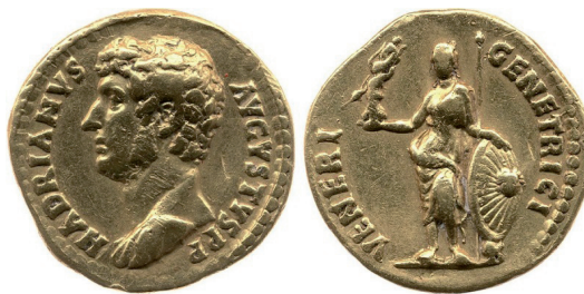
Fot. 3. RIC II/3 Hadrian , nr 1433. Aureus, Rzym. Aw.: HADRIVS AVGVSSTVS P P. Rew.: VENERI GENETRICI