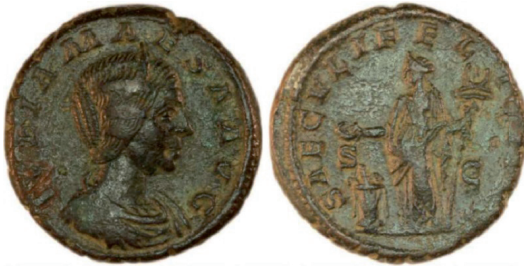
Fot. 10. RIC IV/2 Julia Maesa , nr 424. Dupondius/as, Rzym. Aw.: IVLIA MAESA AVG. Rew.: SAECVLI FEL[ICITAS] SC