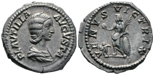
Fot. 8. RIC IV/1 Plautilla , nr 369. Denar, Rzym. Aw.: PLAVTILLA AVGVSTA. Rew.: VENVS VICTRIX

Emisje Plautilli ( Fulvia Plautilla ) ukazują stojącą przodem Wenus, trzymającą w prawej wyciągniętej ręce jabłko, w lewej, opartej na tarczy – gałąź palmową. Przed boginią umieszczono figurkę Kupidyna (fot. 8) 22 .