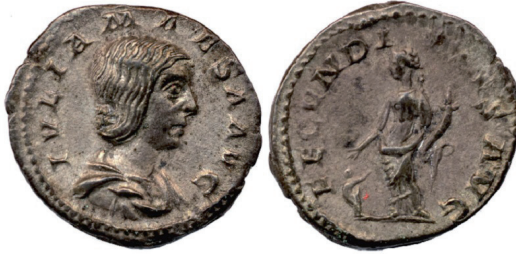
Fot. 9. RIC IV/2 Julia Maesa , nr 249. Denar, Rzym. Aw.: IVLIA MAESA AVG. Rew.: FECVNDITAS AVG