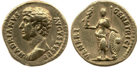
Fot. 3. RIC II/3 Hadrian , nr 1433. Aureus, Rzym. Aw.: HADRIANVS AVGVSTVS P P. Rew.: VENERI GENETRICI