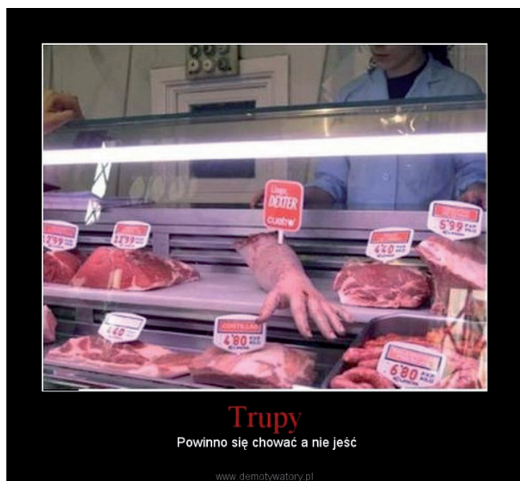
Fot. 7. Przykład mema, w którym podkreślono podobieństwa anatomiczne między ludźmi a pozostałymi zwierzętami