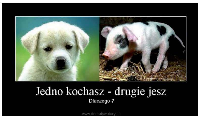
Fot. 5. Przykład memu prowegańskiego pokazującego opozycję: „jedno kochasz – drugie zjadasz”

Biorąc pod uwagę budowę memów, można powiedzieć, że prowegańskie memy nie różniły się od antywegańskich. Tutaj również dominowały klasyczne memy złożone z ilustracji i podpisu. Wykorzystywały także wizerunki znanych osób, jak Gandhi, Natalie Portman. Wiele memów koncentrowało się na opozycji: „jedne kochasz – drugie zjadasz”, z którymi korespondował mem antywegański.