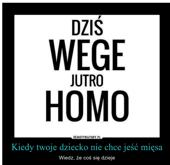
Fot. 3. Przykład memu, w którym weganizm zestawiony zostaje z homoseksualizmem, a homoseksualizm przedstawiany jest jako zagrożenie

Weganizm był również utożsamiany z sektą lub obcą ideologią. Pojawiały się także nawiązania do nazizmu i homoseksualizmu, weganie zaś przedstawiani byli jako mało mężczy – dieta mięsna była bowiem wyznacznikiem i symbolem męskości.