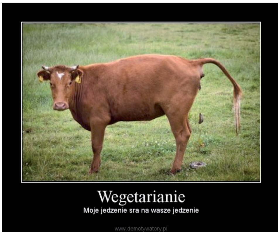
Fot. 4. Przykład memu, na którym zwierzęta zostają ukazane jako jedzenie

W antywegańskich memach dominowała mowa nienawiści i szowinizm gatunkowy. Jedzenie mięsa ukazywane było jako element tradycji zgodnej z prawami natury, świadczący o normalności. Weganizm z kolei widziany był jako wynaturzenie, choroba, dziwactwo, fanaberia oraz zamach na naturę. Twórcy antywegańskich memów reprezentowali przedmiotowy stosunek do zwierząt. Człowiek przyjmował pozycję dominującą, podczas gdy status zwierząt zrównany został ze statusem jedzenia i roślin.