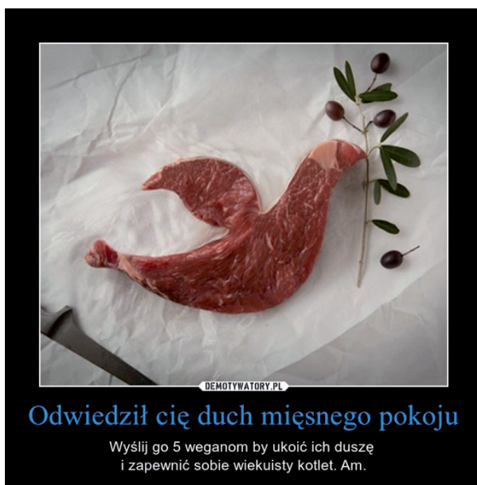
Fot. 2. Przykład mema antywegańskiego wykorzystującego nawiązania religijne