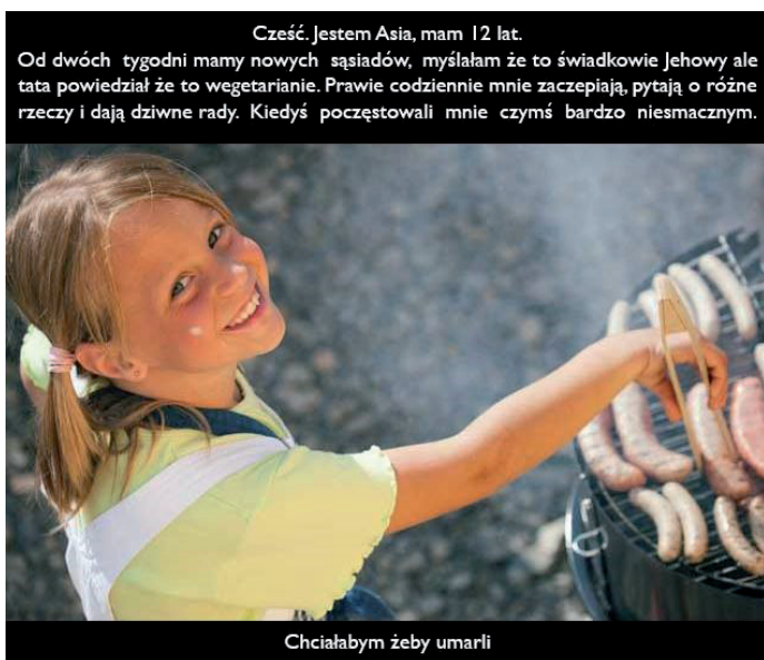
Fot. 1. Przykład antywegańskiego mema stylizowanego na tabloid.