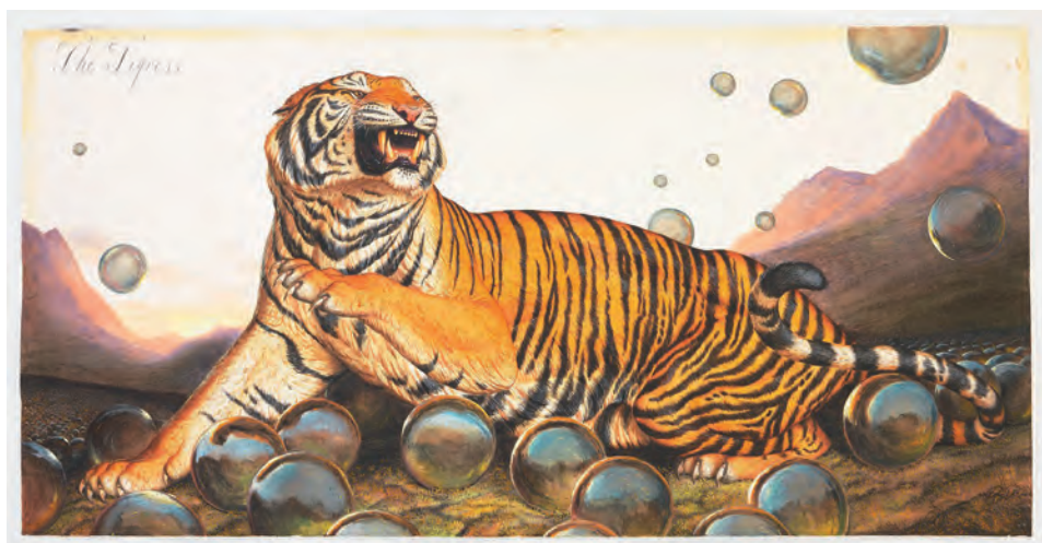
Ryc. 1. Walton Ford: The Tigress (2013).