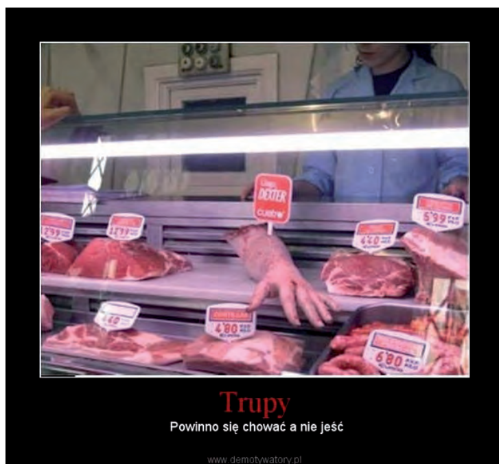
Fot. 7. Przykład mema, w którym podkreślono podobieństwa anatomiczne między ludźmi a pozostałymi zwierzętami