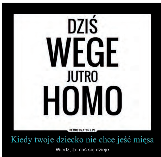
Fot. 3. Przykład mema, w którym weganizm zestawiony zostaje z homoseksualizmem, a homoseksualizm przedstawiany jest jako zagrożenie

Weganizm był również utożsamiany z sektą lub obcą ideologią. Pojawiały się także nawiązania do nazizmu i homoseksualizmu, weganie zaś przedstawiani byli jako mało męscy – dieta mięsna była bowiem wyznacznikiem i symbolem męskości.