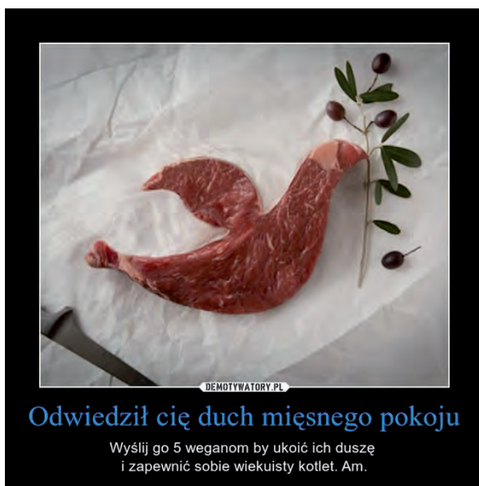
Fot. 2. Przykład memu antywegańskiego wykorzystującego nawiązania religijne