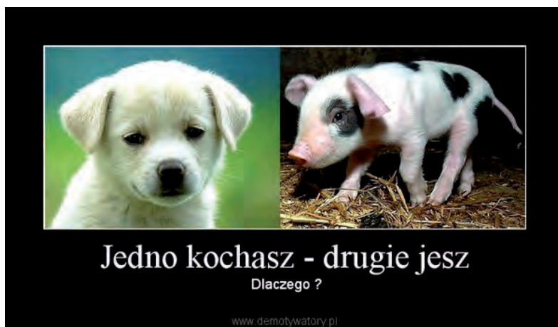
Fot. 5. Przykład memu prowegańskiego pokazującego opozycję: „jedno kochasz – drugie zjadasz”

Biorąc pod uwagę budowę memów, można powiedzieć, że prowegańskie memy nie różniły się od antywegańskich. Tutaj również dominowały klasyczne memy złożone z ilustracji i podpisu. Wykorzystywały także wizerunki znanych osób, jak Gandhi, Natalie Portman. Wiele memów koncentrowało się na opozycji: „jedne kochasz – drugie zjadasz”, z którymi korespondował mem antywegański.