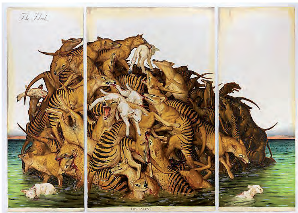
Рис. 2. Walton Ford: The Island (2009).