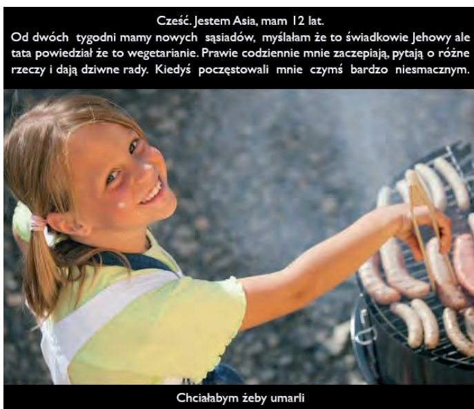
Fot. 1. Przykład antywegańskiego memu stylizowanego na tabloid.