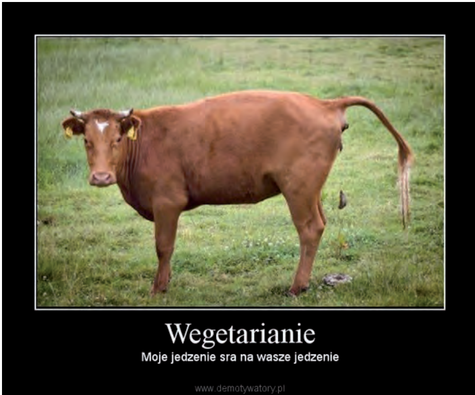
Fot. 4. Przykład memu, na którym zwierzęta zostają ukazane jako jedzenie

W antywegańskich memach dominowała mowa nienawiści i szowinizm gatunkowy. Jedzenie mięsa ukazywane było jako element tradycji zgodnej z prawami natury, świadczący o normalności. Weganizm z kolei widziany był jako wynaturzenie, choroba, dziwactwo, fanaberia oraz zamach na naturę. Twórcy antywegańskich memów reprezentowali przedmiotowy stosunek do zwierząt. Człowiek przyjmował pozycję dominującą, podczas gdy status zwierząt zrównany został ze statusem jedzenia i roślin.