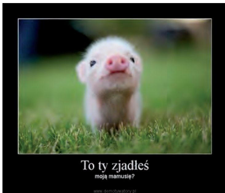
Fot. 6. Przykład mema, na którym zastosowana została terminologia związana z rodziną