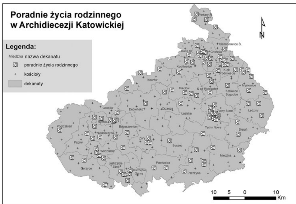
Ryc. 1. Poradnie życia rodzinnego w Archidiecezji Katowickiej.

Najwięcej parafii Archidiecezji Katowickiej, w których prowadzone są zarówno nauki przedmałżeńskie, jak i poradnie życia rodzinnego, znajduje się w jej północno-wschodniej i zachodniej części oraz w obrębie dekanatów Tychy Nowe i Tychy Stare. Największe zróżnicowanie form nauk przedmałżeńskich występuje natomiast w dekanacie Katowice Śródmieście, a więc w centralnej części stolicy województwa śląskiego. Najmniej poradni życia rodzinnego oraz ośrodków katechez przedmałżeńskich funkcjonuje w parafiach środkowej części Archidiecezji Katowickiej (dekanaty: Dębieńsko, Orzesze, Łaziska). Kilka ośrodków, w których odbywają się nauki przedmałżeńskie „Przed Nami Małżeństwo”, to domy rekolekcyjne Archidiecezji Katowickiej znajdujące się poza jej granicami – Bielsko-Biała, Górk Wielkie czy Koniaków (Ryc.1, 2).