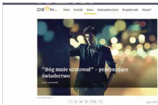
Rys. 1. Fotografia stokowa zaczerpnięta z ogólnie dostępnych zasobów internetowych

Do drugiej grupy należy zaliczyć wypowiedzi audialne wspierane obrazem. Dzieje się tak, gdy świadectwo słowne zostało nagrane, a raczej zarejestrowane, następnie zestawione z uniwersalnym w swej wymowie plakatem, rodzajem znaku graficznego, logo (np. wyciągnięta dłoń na tle bladuróżowego, podświetlanego pola). Takie samo rozwiązanie może towarzyszyć więcej niż jednej prezentacji świadectwa, jak np. Świadectwo Izy – byłej bioenergoterapeutki 22 czy Świadectwo uwolnienia Uli – byłej zakonnicy (rys. 2) 23 .