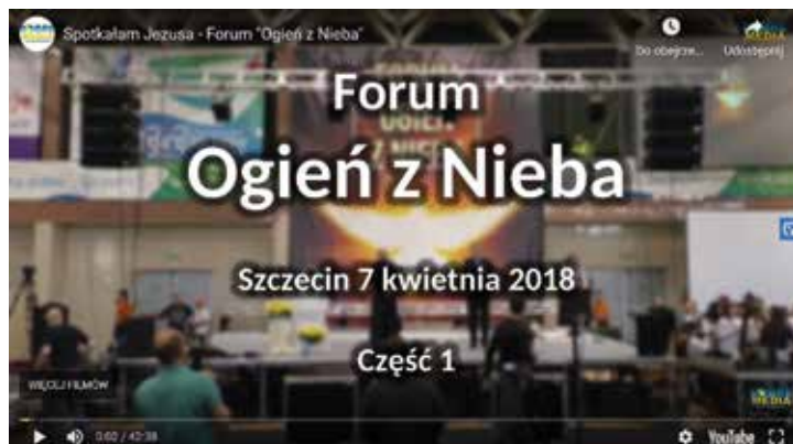
Rys. 3. Wideorejestracje

wideoblogi, reportaże) 26 , wyprodukowane przez telewizję ewangelizacyjną i fundację Dobre Media 27 , która specjalizuje się w transmisjach z wydarzeń religijnych o zróżnicowanej skali (rys. 3).