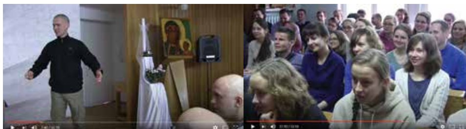
Rys. 8. Wyrwani z niewoli. Świadek Piotra i Jacka . Rejestracja „na żywo”

Niski kąt spojrzenia kamery wskazuje na siłę ekspresji. Oczywiście i tutaj werbalizacja jest podstawowym nośnikiem treści. Sceneria ukazuje wnętrze sali z wizerunkiem Matki Bożej Częstochowskiej, wypełnioną – jak się wydaje – młodymi mężczyznami. Obraz sugeruje, iż być może mamy do czynienia z jedną z subkultur młodzieżowych (mężczyźni ostrzyżeni na tyso). Jest to jednak jedynie sugestia, niedopowiedzenie (zamierzone?). Punkt widzenia kamery prezentującej bohatera zmienia się – plan bliski, średni, amerykański, szczegół, liczne zbliżenia.