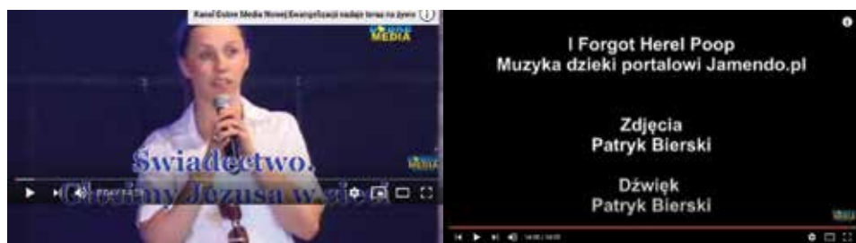
Rys. 5. Seria audiowizualnych świadectw Głosimy Jezusa w Sieci

Audiowizualna forma gatunku dokumentu osobistego, jaką jest opowieść o minionym życiu bohatera filmiku, skierowana jest do widza za pośrednictwem kamery. Ten audiowizualny monolog, prowadzony przy użyciu narracji filmowej,