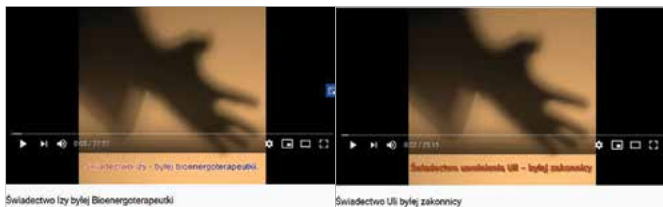
Rys. 2. Znak graficzny towarzyszący wypowiedzi audialnej

Do drugiej grupy należy zaliczyć wypowiedzi audialne wspierane obrazem. Dzieje się tak, gdy świadectwo słowne zostało nagrane, a raczej zarejestrowane, następnie zestawione z uniwersalnym w swej wymowie plakatem, rodzajem znaku graficznego, logo (np. wyciągnięta dłoń na tle bladuróżowego, podświetlanego pola). Takie samo rozwiązanie może towarzyszyć więcej niż jednej prezentacji świadectwa, jak np. Świadectwo Izy – byłej bioenergoterapeutki 22 czy Świadectwo uwolnienia Uli – byłej zakonnicy (rys. 2) 23 .