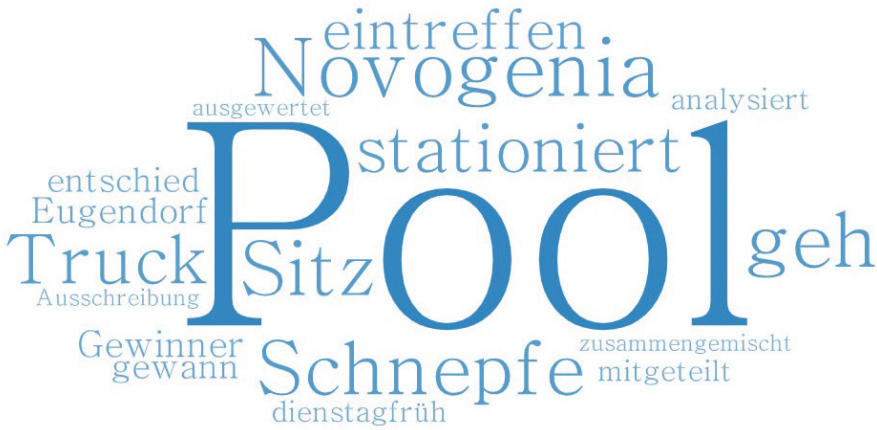
Abbildung 4: Häufigste Kollokatoren des Lexems Labor in der 4. Welle

Diese beziehen sich einerseits auf die Einführung von neuen, kostengünstigeren Verfahren der Corona-Test-Analysen, z.B. „Die Auswertung der Tests erfolge im sogenannten Pooling-Verfahren, das schnellere und kostengünstigere Testungen erlaubt. Dazu werden jeweils zehn Proben in einem Pool zusammengemischt und im Labor analysiert“ („vol.at“, 21.10.2021), und andererseits auf die Errichtung von neuen Laboren, also neuen Orten für Testanalysen, z.B. „Für eine schnellere Auswertung der Tests soll, ebenfalls bei der Messe stationiert, noch im Dezember ein »Labor-Truck« in Betrieb gehen“ („vol.at“, 7.12.2021). Nicht zuletzt wird auch Wissen über österreichische Firmen als Testanbieter vermittelt, z.B. Novogenia .