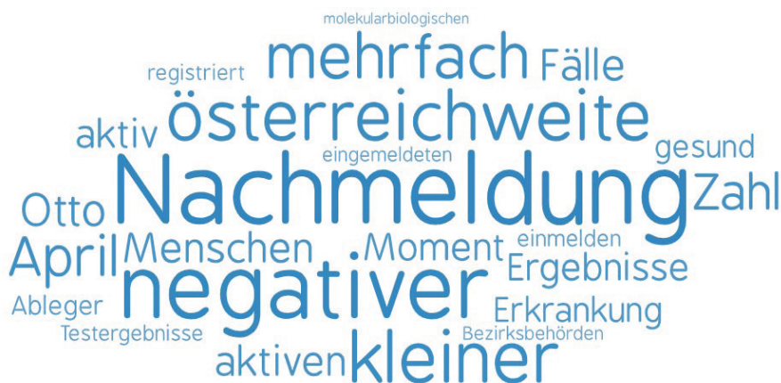
Abbildung 2: Häufigste Kollokatoren des Lexems Labor in der 2. Welle

Die Kollokatoren in der 2. Welle der Corona-Pandemie in Österreich, visualisiert in der Wortwolke unten (vgl. Abb. 2), zeugen bereits von einer anderen Verwendungsweise des Lexems Labor .