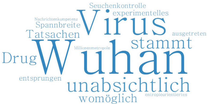
Abbildung 1: Häufigste Kollokatoren des Lexems Labor in der 1. Welle

Die Wortwolke (vgl. Abb. 1) veranschaulicht die häufigsten Kollokatoren des Lexems Labor in den Texten, die der 1. Welle zugeordnet werden können.