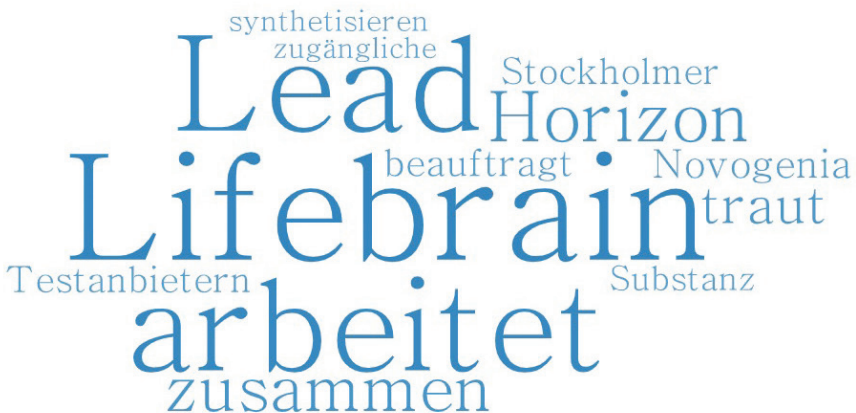
Abbildung 5: Häufigste Kollokatoren des Lexems Labor in der 5. Welle