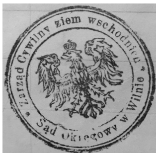
Fot. 3. Pieczęć Sądu Okręgowego w Wilnie (1919 r.)