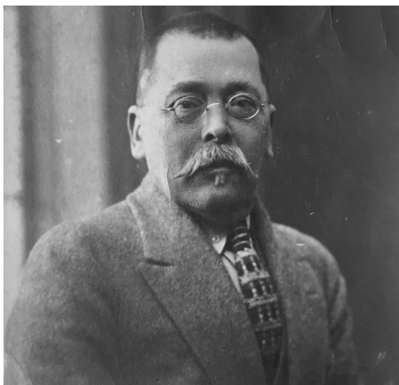
Fot. 4. Adolf Zmaczyński (1861—1926)