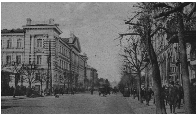
Fot. 2. Gmach (po lewej) Sądu Okręgowego w Wilnie (b.d.)