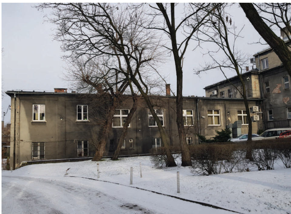
Fot. 2. Siedziba Wydziału Prawa i Administracji w latach 1969—2003 przy ul. Bankowej 8—10

W 1967 r. Prezydium WRN w Katowicach oraz KW PZPR oddały do dyspozycji Filii UJ budynek przy ul. Bankowej 8—10 — mieścił się tam wtedy ośrodek szkolenia partyjnego oraz biblioteka tego ośrodka. Co ciekawe, wcześniej, w dwudziestoleciu międzywojennym, w tym modernistyczno-neoklasycystycznym budynku siedzibę swoją miało biuro Krajowej Rady Kościelnej Ewangelickiego Kościoła Unijnego na Polskim Górnym Śląsku i Ewangelicki Dom Związkowy, zaś w latach powojennych budynek ten został parafii odebrany i przekazany — najpierw Państwowym Zakładom Wydawniczym, a później Komitetowi Miejskiemu PZPR. Mimo że parafia ewangelicka prawa do budynku odzyskała na mocy Komisji Regulacyjnej w latach 1995—1996, Wydział Prawa i Administracji działał tu jeszcze do 2003 r.