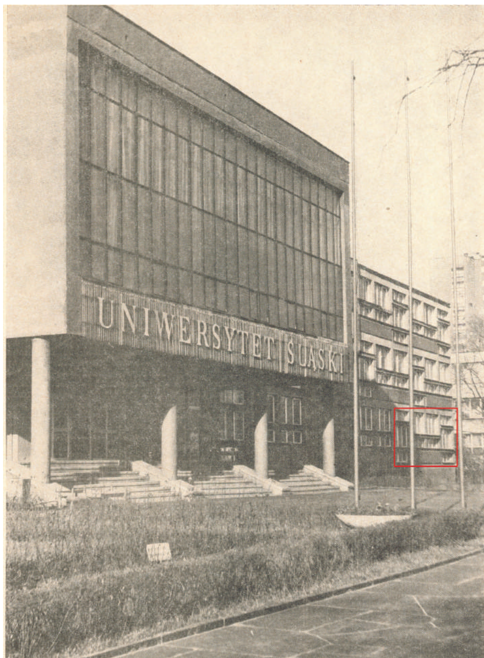
Fot. 1. Pierwsza siedziba Biblioteki Wydziału Prawa i Administracji UŚ w budynku rektoratu (do 1969 r.)