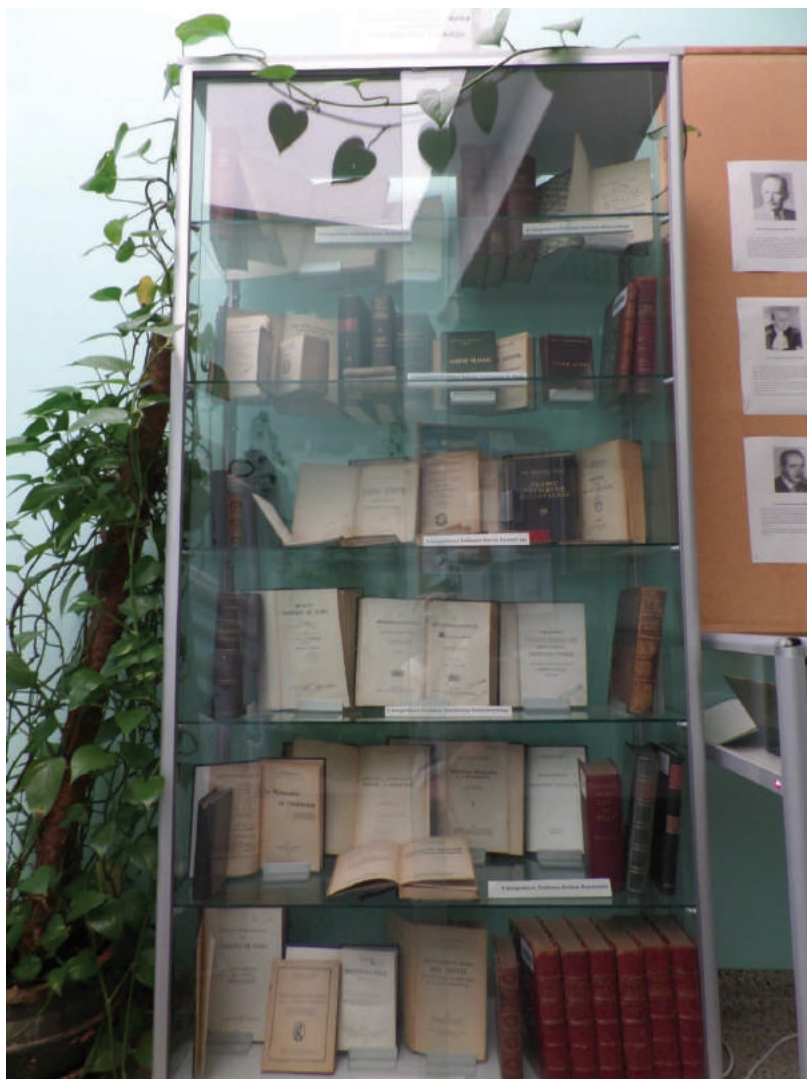
Fot. 7. Wystawa zorganizowana z okazji obchodów jubileuszu 50-lecia Wydziału Prawa i Administracji w Bibliotece, poświęcona skarbow i księgozbiorom po zmarłych profesorach znajdujących się w zbiorach

pejska i prawo”, wystawę związaną z obchodami jubileuszu 50-lecia naszego Wydziału, poświęconą znajdującym się w naszych zasobach skarbow i księgozbiorom po zmarłych profesorach, wystawy poświęcone naszym wybitnym profesorom, wystawę poświęconą historii naszej Biblioteki, czy — zorganizowaną ostatnio z okazji 20-lecia uchwalenia Konstytucji RP — wystawę poświęconą historii Konstytucji.