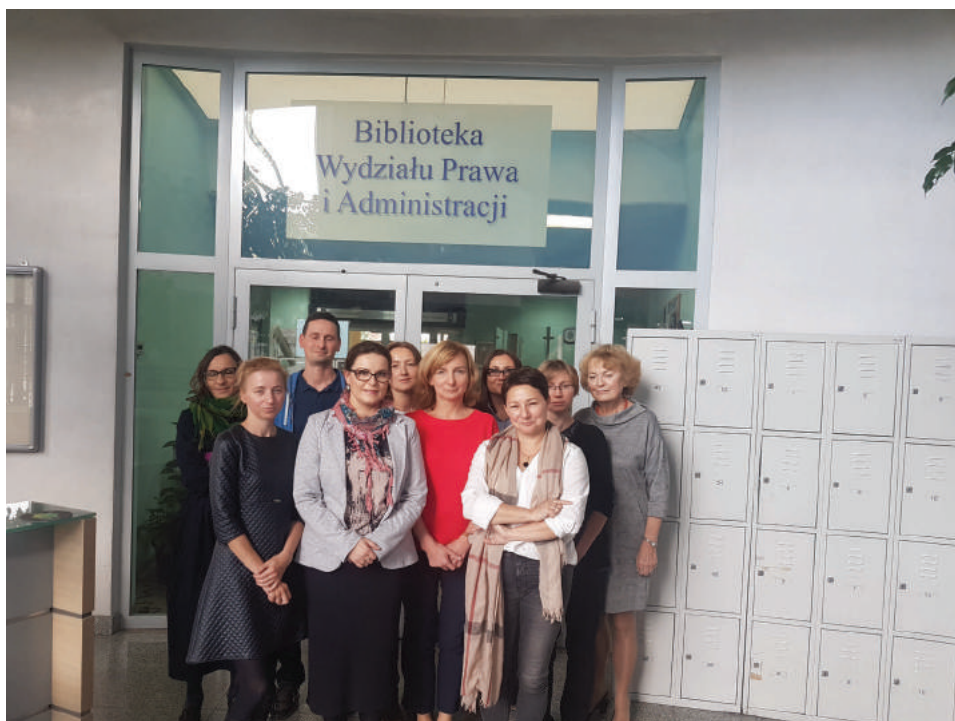
Fot. 9. Obecni pracownicy przed wejściem do Biblioteki WPiA

Opisana tu historia Biblioteki Wydziału Prawa i Administracji UŚ nie jest oczywiście kompletna, bo nie taki był nasz cel. Ale — co warto podkreślić — w historii tej jak w soczewce skoncentrowały się problemy — społeczne, ekonomiczne, polityczne kraju i regionu — jakich świadkami przez te lata była Biblioteka i jej pracownicy. Doświadczenia te mają swoje odbicie zarówno w zmiennym charakterze księgozbioru, warunkach pracy, wciąż zmieniających się narzędziach. Przez 50 lat zmieniło się niemal wszystko, poza jednym — misją, jaką jest praca bibliotekarza.