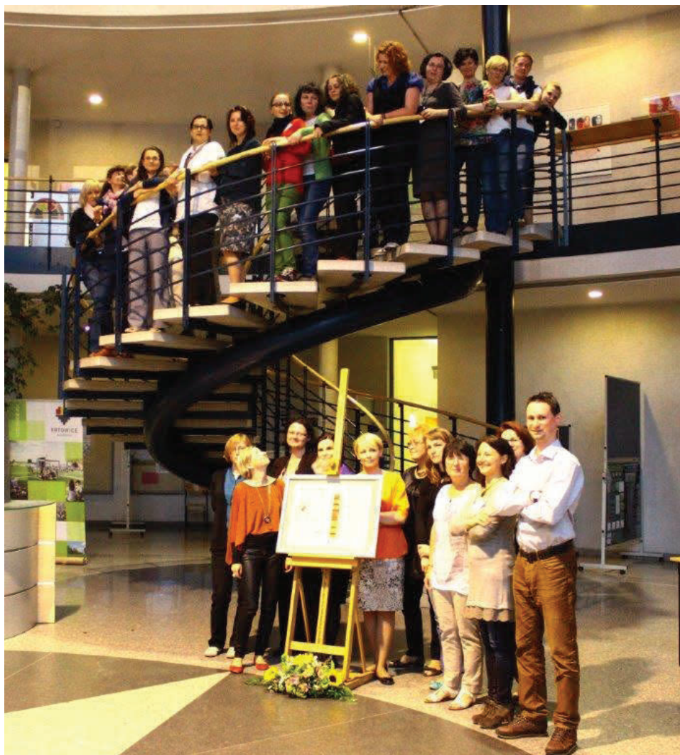
Fot. 8. Uczestnicy Spotkania Kierowników Bibliotek Prawniczych — Katowice 2014