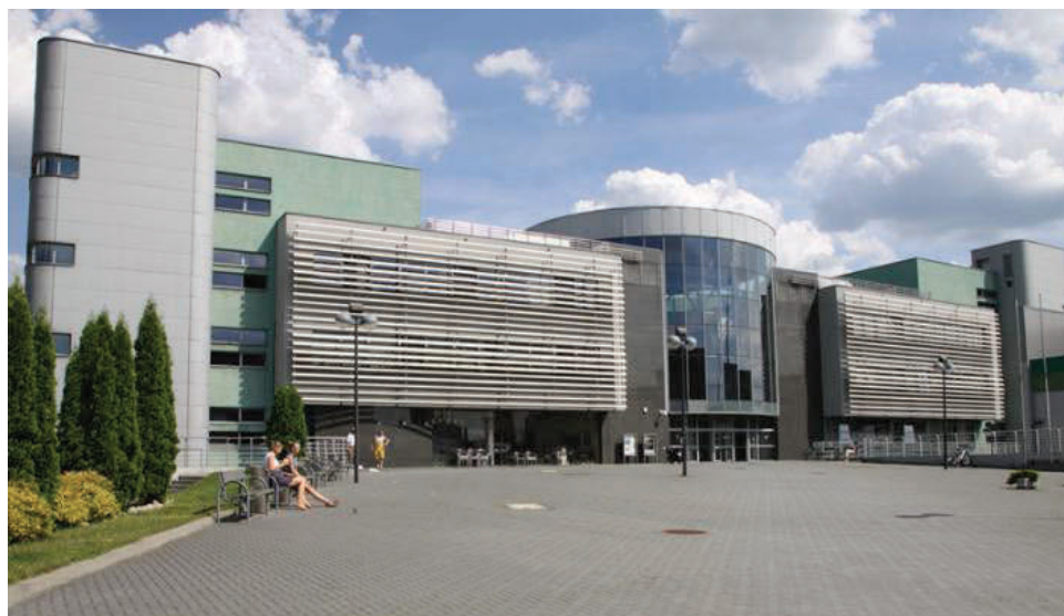
Fot. 3. Obecna siedziba Wydziału Prawa i Administracji i jednocześnie Biblioteki, ul. Bankowa 11b

Kolejna poprawa lokalowa nastąpiła w 1989 r., kiedy przejęto kolejne pomieszczenia, tym razem w przyziemiu budynku — po stołówce. Powierzchnia całkowita wzrosła do 930 m 2 . Już w styczniu 1989 r. rozpoczęto remont i przenosiny księgozbioru. Dawną stołówkę zaadaptowano na magazyn biblioteczny, a w byłym magazynie można było wreszcie urządzić odpowiednią czytelnię ze znacznie większym księgozbiorem podręcznym i 70 miejscami dla czytelników. W takim stanie Biblioteka dotrwała do 2003 r., kiedy to nastąpiła kolejna przeprowadzka, tym razem już do własnego, nowo wybudowanego (i jeszcze nieukończonego wówczas) gmachu przy ul. Bankowej 11b, gdzie obecnie odbywają się wszystkie zajęcia i praca Wydziału.