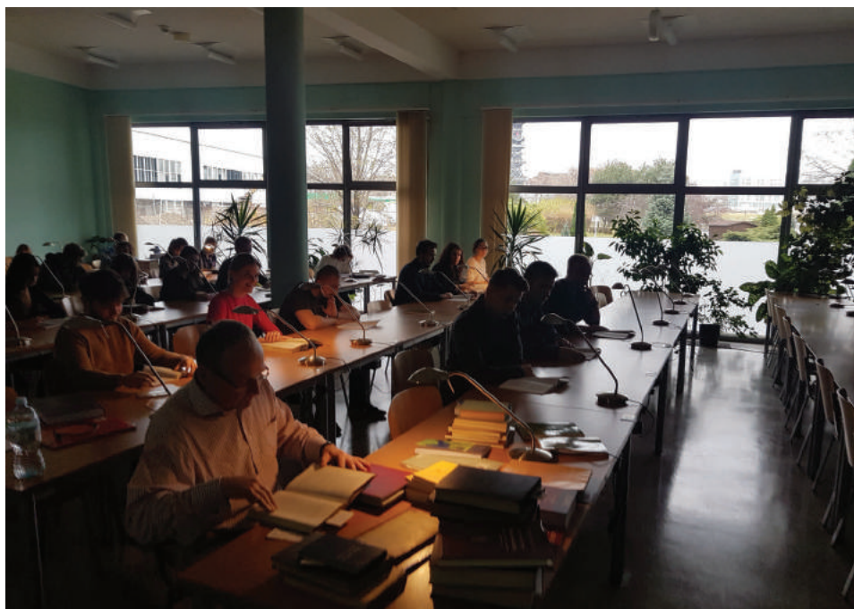
Fot. 6. Czytelnia. Biblioteka WPiA

W 2008 r., po zakupieniu bramki, zainicjowaliśmy w czytelni wolny dostęp do księgozbioru. Czytelnicy mogą swobodnie korzystać z materiałów, bez konieczności udostępniania poszczególnych egzemplarzy przez system informatyczny.